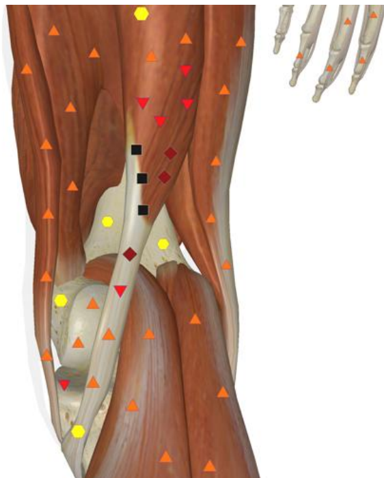
Рис 3. NLS-графия нижней конечности. Патологическая тракция, при поперечном надрыве правой полусухожильной мышцы бедра.

мышцы, ведущих к ограничению спортивной активности. Данный факт указывает на важность NLS-исследования в диагностике мышечной травмы у спортсменов.