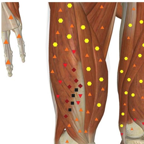
Рис 1. NLS-графия нижней конечности. Поперечный разрыв правой прямой мышцы бедра.